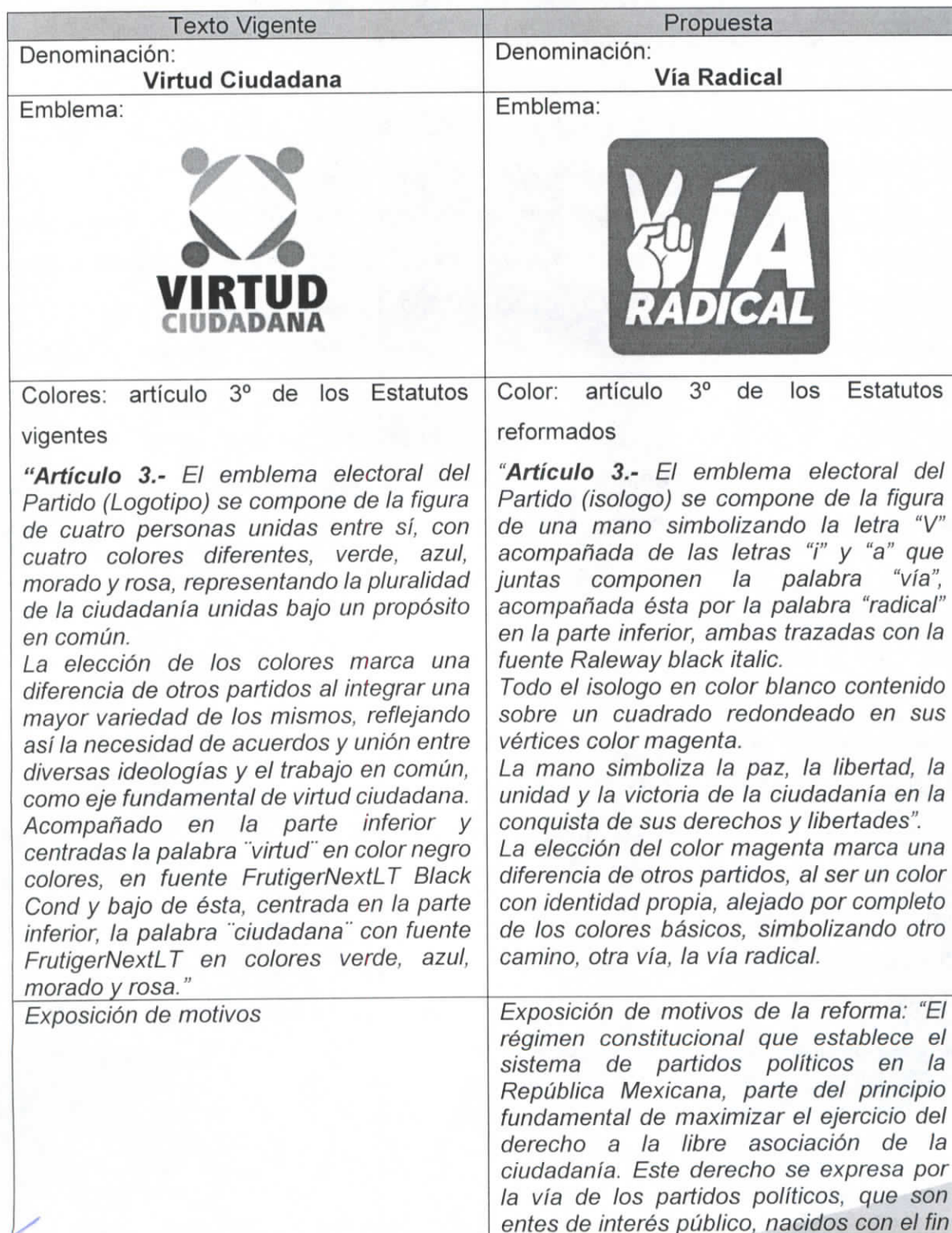
Tabla 5. Comparativo de la denominación y el emblema.