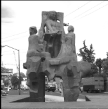
Monumento al Maestro