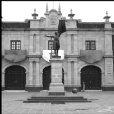
Monumento a Hidalgo Plaza Cívica de Toluca