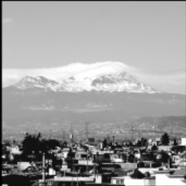
Volcán Kinantecatl (Municipio de Toluca)