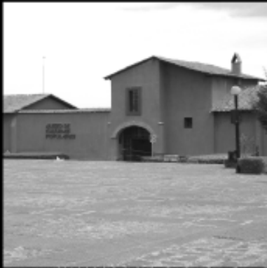
Museo de Culturas Populares Centro Cultural Mexiquense