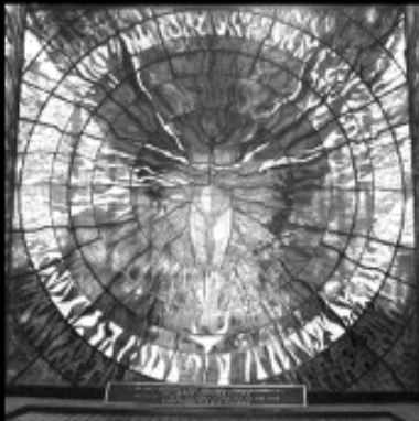
Jardín Botánico Cosmovitral