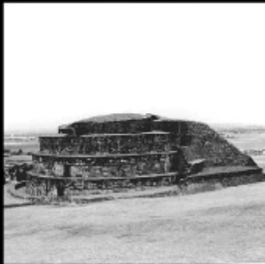
Ruinas Arqueológicas de Calixtlahuaca