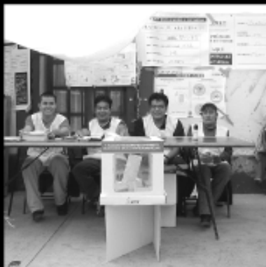
Funcionarios de Mesa Directiva de Casillo