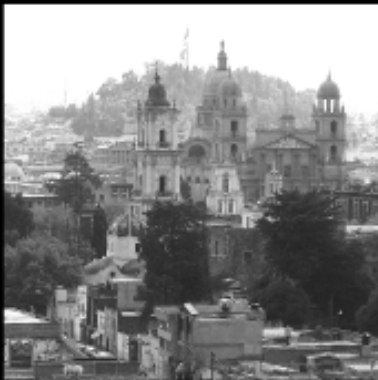
Vista Panorámica Ciudad de Toluca de Lerdo