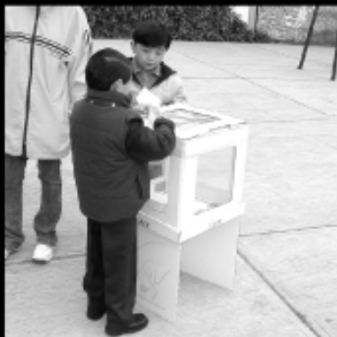
Jornadas Cívicas Escolares