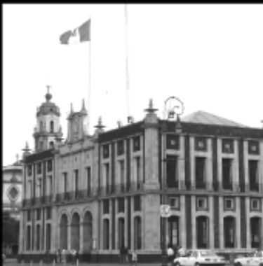
Palacio Municipal de la Ciudad de Toluca