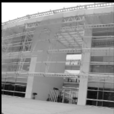
Instituto Electoral del Estado de México